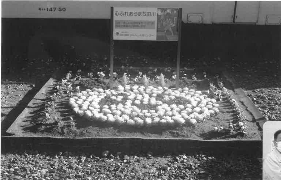
優勝 田川地区シルバー人材センター『パンダより愛をこめて』