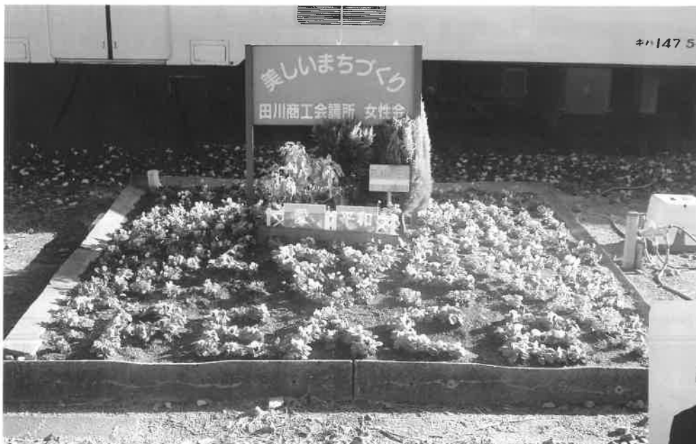
JR田川後藤寺駅長賞 田川商工会議所女性会『Love&Peace』