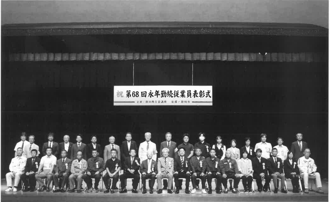
祝 第68回永年勤続従業員表彰式

〒826-0025 福岡県田川市大黒町3-11 TEL 0947-44-3150 FAX 0947-45-6073 URL : https://www.tagawa.or.jp