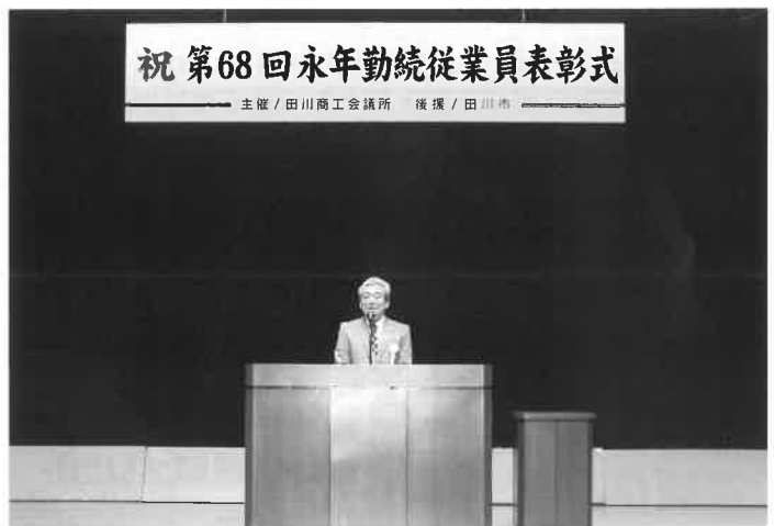
祝 第68回永年勤続従業員表彰式

9月20日(水) 田川青少年文化ホールにて『第68回永年勤続従業員表彰式』が開催されました。 3年ぶりの式典実施となりましたが、事業主・被表彰者・御来賓を交え、厳かなながらも晴れやかに挙行されました。