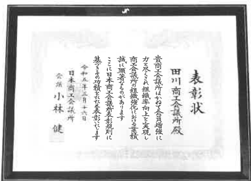
商工会議所表彰状

これからも田川商工会議所は地域の総合経済団体として会員皆さまのお役に立てるよう邁進してまいります。