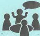
ファシリテーターの進行で 活発なディスカッションを促進