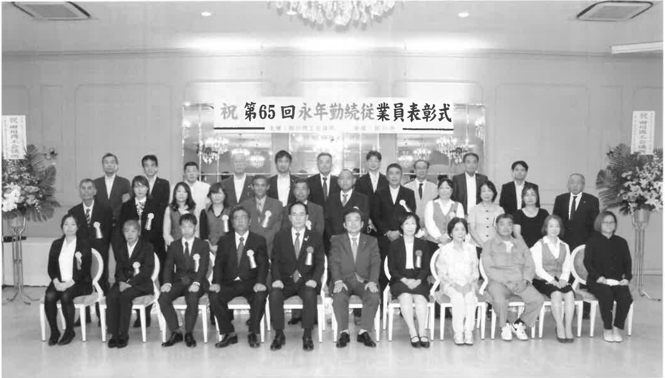
当日出席された被表彰者、事業主、関係者の皆様