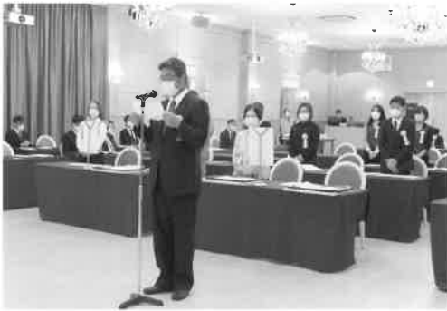
表彰を受けられた皆様、おめでとうございます!