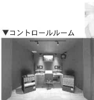
▼コントロールルーム

筑豊ダンススタジオは、福岡県田川市にスタジオを構えており、平成筑豊鉄道（ほしい）駅から徒歩1分の場所にあり、電車でお越しいただけます。もちろんお車でお越しいただく方のための駐車場も完備しています。 社交ダンスは一人で楽しむことができないものですし、たくさんの仲間と一緒に踊れば、楽しさはなお膨らみます。ダンス経験のない方にも丁寧にレッスンを致しますので、田川市や飯塚市のお近くにお住まいの方は是非スタジオへお越し頂き、社交ダンスを通じて新しい楽しみや仲間を見つけてみてはいかがでしょうか。ハイレベルな社交ダンス教室をはじめ、健康と美しい姿勢のためのエレガントポスチャー教室、元気な子どもたちを対象としたHIPHOP、ブレイクダンス教室、さらにはネイティブ講師による本場の英会話教室など、楽しい教室がたくさん開催されています。ぜひ一度、お気軽にお越しください。無料体験も歓迎いたします!