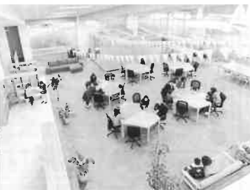
▲コワーキングスペース