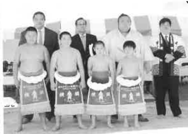
個人の部優勝 (横綱4名)

翌、11月4日(日)には、千賀ノ浦部屋力士の皆さんにご協力を頂き、飛び入り参加の児童も交えての「ふれあい相撲」を実施致しました。ユーモア溢れる展開に、参加した児童も大喜びで、2日間の日程は成功のうちに終了することができました。今大会へご協賛・ご協力をいただきました皆様、当日お越しくださった皆様に御礼申し上げます。ありがとうございました。