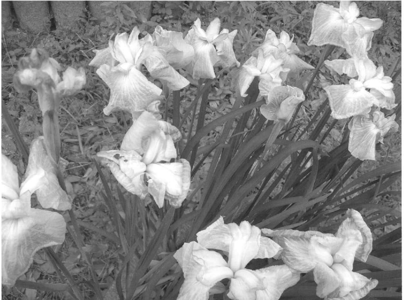
成道寺公園の菖蒲池

〒826-0025 福岡県田川市大黒町3-11 TEL 0947-44-3150 FAX 0947-45-6073 URL : http://www.tagawa.or.jp