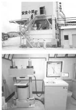
もの補助で取得した試験機

会員事業所の紹介（商品、イベント情報、事業所内容等）を無料で掲載いたします。自他推薦は問いませんので、PRしたい事業所をぜひご紹介ください。※ただし田川商工会議所会報は2ヶ月に1度の発行です。1回につき2事業所の掲載となりますので、お申込多数のときは、順次掲載致します。