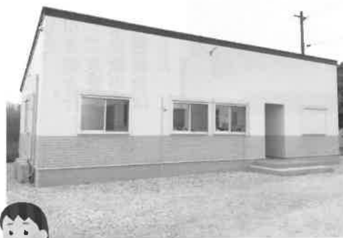
放課後等デイサービス 放課後そらいろルーム