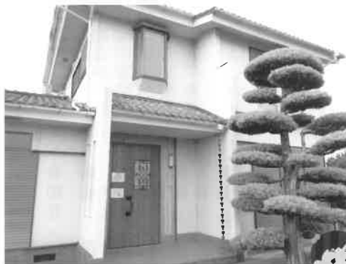
児童発達支援事業所 子育てサポートいろは園