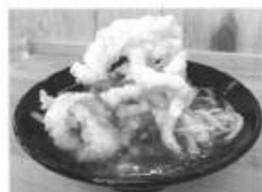
いか天うどん。ふりふりのイカがふんだんにのって650円!