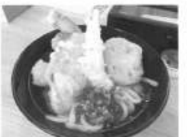
天ぷらうどん。海老、さつまいも、人参、かぼちゃ、れんこんというボリュームで650円!