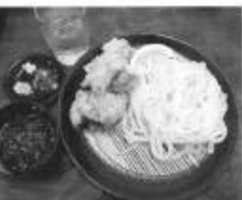
名物かしわざるうどん