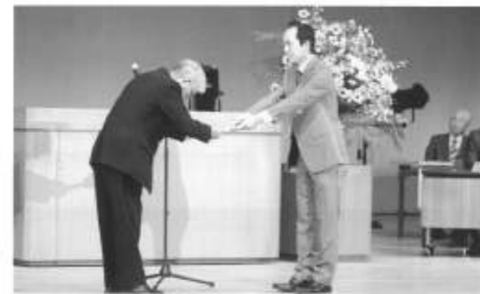
記念モニュメント贈呈